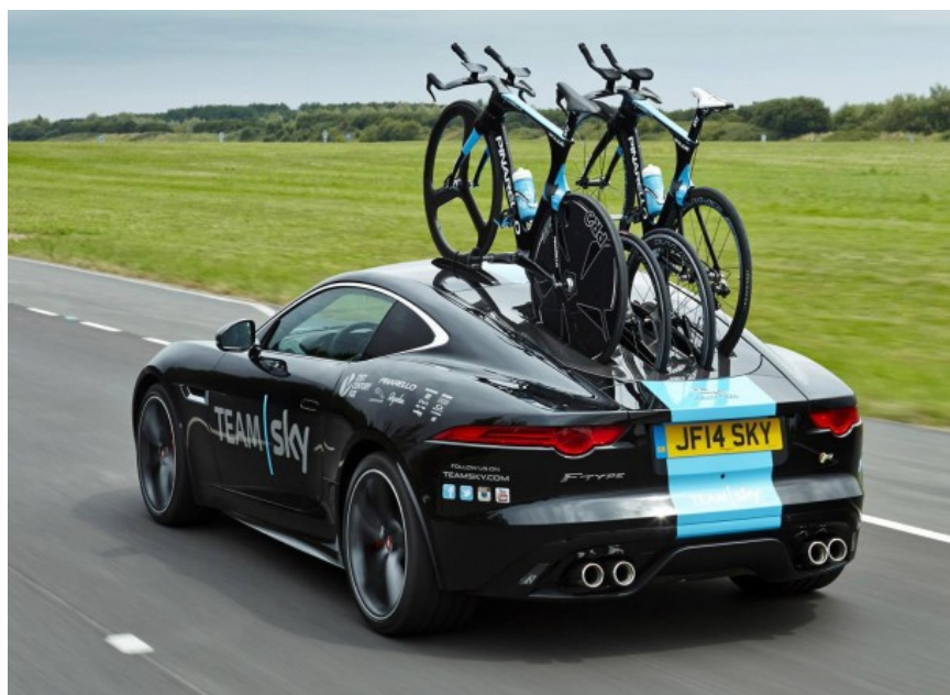
כשיגואר תבעה את ג'אגר.

על פי טענת יגואר, באמצעות עוה"ד הני רוזנצוויג ושות', סימן המסחר "ג'אגר בייקס" דומה עד כדי להטעות לסימני המסחר שלה. עוד טענה יגואר כי לאור התאוצה שחלה בשוק האופניים החשמליים והעובדה שהם נתפשים יותר ויותר כתחליף לרכבים פרטיים, קיים חשש להטעיית לקוחות כך שיחשבו שאופני "ג'אגר בייקס" הינם מבית "יגואר". יצרנית האופניים, שיוצגה על ידי משרד עוה"ד בוסתנאי הדגישה כי לא קיים סיכוי שרוכשי אופניים חשמליים יתבלבלו ויחשבו שמדובר במוצר מבית יגואר.