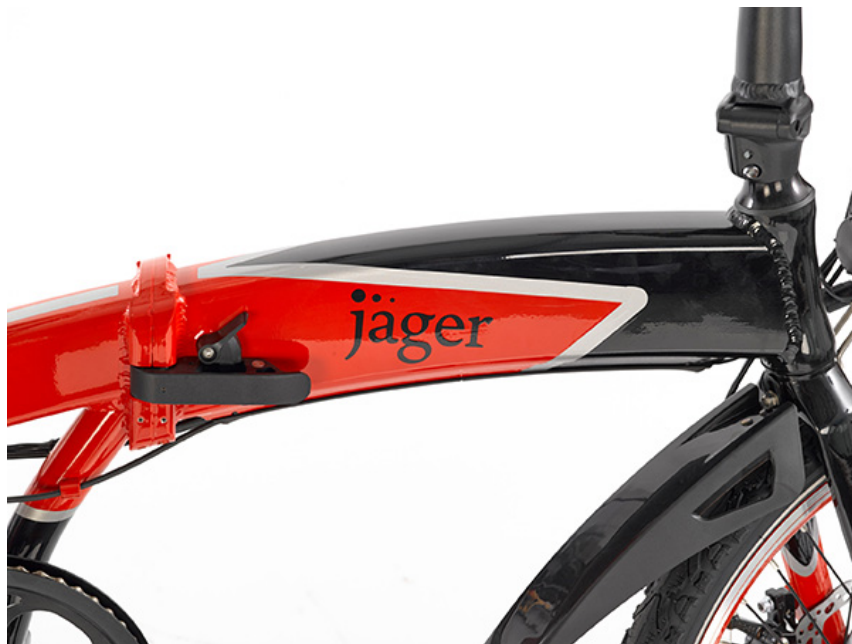
זה דומה מדי ליגואר?